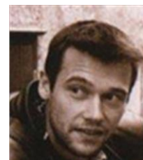
Fane La légende du little Boost