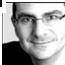
Christophe Arleston Lanfeust de Troy