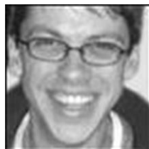
Fabien Velhmann L'île aux cent mille morts