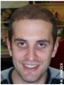
Batist Les chaussettes trouées