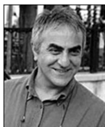
Liberatore Les femmes de Liberatore