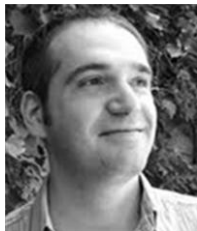
Emmanuel Roudier Neandertal