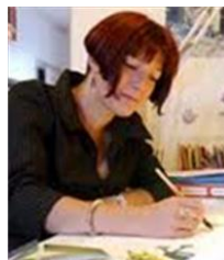
Turrel Sophie Histoires de chats