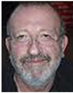
Cothias Le fils de l'officier